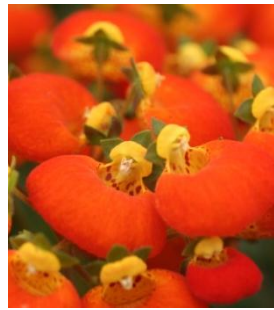
14010 sel® Calynopsis Orange