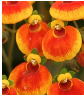
14008 sel® Calynopsis Yellow with Red