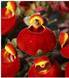
14011 sel® Calynopsis Red